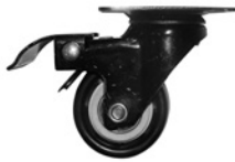
Rodos / Rodos.