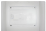
Interior illumination / Iluminación interior.