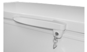
Lock system with key / Sistema de cerradura con llave.